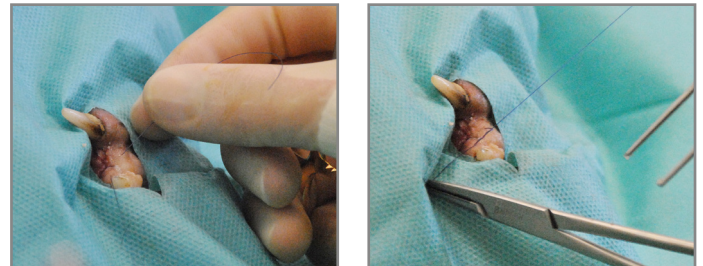
2: Comienzo de la sutura de la mucosa gingival

Debe realizarse una aposición anatómica de los bordes gingivales sin provocar una tensión excesiva, de modo que se garantice una buena vascularización de la herida. Los extremos del hilo de sutura se suelen dejar en la boca. No suele ser necesario retirar los puntos de sutura.