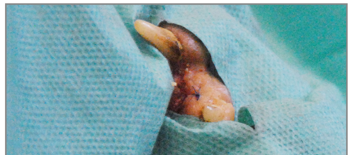
3: Sutura de la mucosa gingival completada

La encía es un tejido que se caracteriza por su rápida cicatrización, por lo que en ella debe utilizarse un material de sutura que genere una reacción breve y se absorba rápidamente.