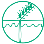
Cierre de la piel