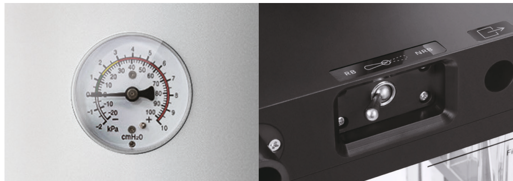
Interruptor para el cambio de circuito anestésico