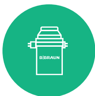
Vaporizador de alta precisión