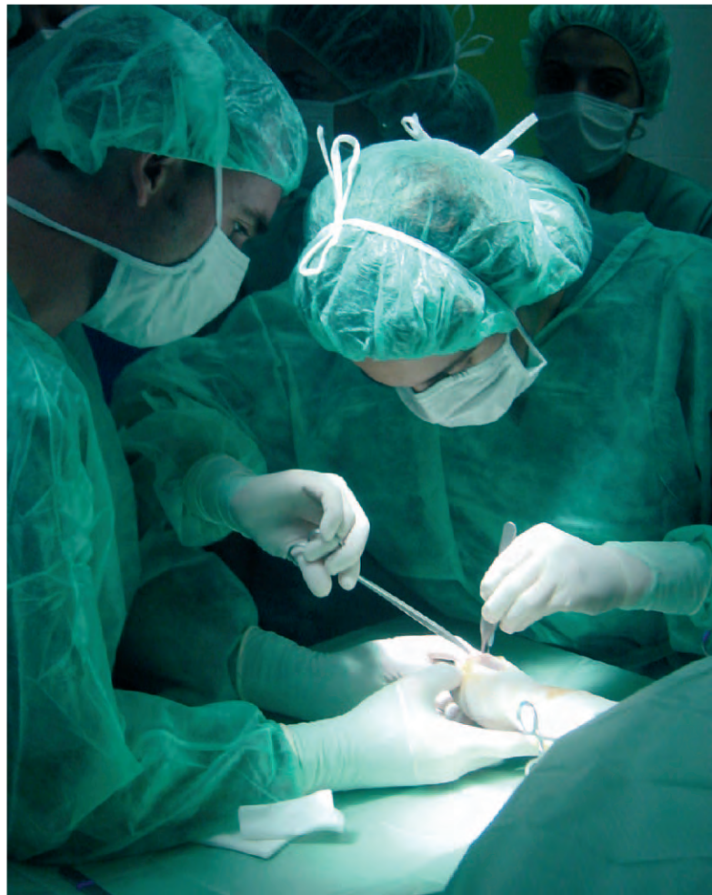
Foto 5. Resolución fractura tibia

El dolor que provoca la inyección es uno de los efectos secundarios más conocidos de este anestésico. Tras emplear propofol en emulsiones grasas con triglicéridos de cadena larga, este efecto se observó con una frecuencia de hasta el 90%. Para reducir el dolor, se han investigado diferentes métodos, tales como la administración de anestésicos locales o analgésicos antes de administrar propofol, enfriamiento de la emulsión, etc. Todos los procedimientos se asocian al riesgo de contaminación de la solución o resultan laboriosos. Aunque se logró disminuir el dolor con algunos de los procedimientos descritos, este problema no pudo resol-