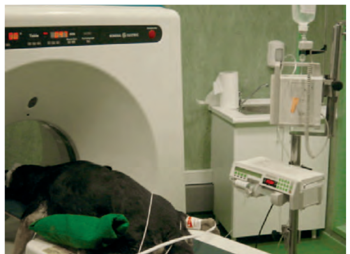
Foto 3. Realización de un TAC. Síndrome vestibular

La velocidad de administración de propofol en la inducción es muy importante puesto que si se administra demasiado rápido, provoca apnea y hay que proporcionar al paciente ventilación manual. Por el contrario, si la administración es demasiado lenta,