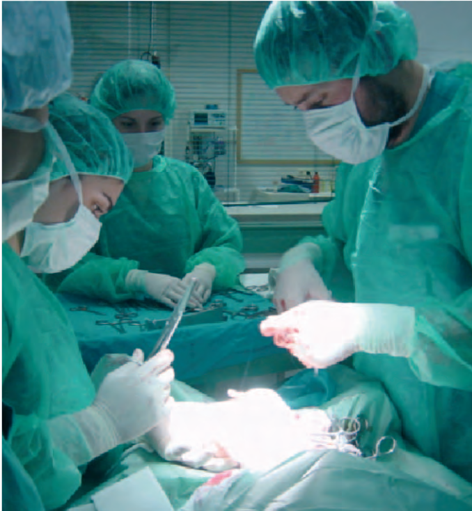
Foto 6. Cistotomía. Extracción cálculo vesical

verse. La nueva formulación de propofol, con triglicéridos de cadena media, evita este problema. Aunque el dolor a la inyección es frecuente, las complicaciones venosas son raras (menos del 0,6%). Las inyecciones perivenosas o intraarteriales no provocan inflamación tisular ni necrosis.