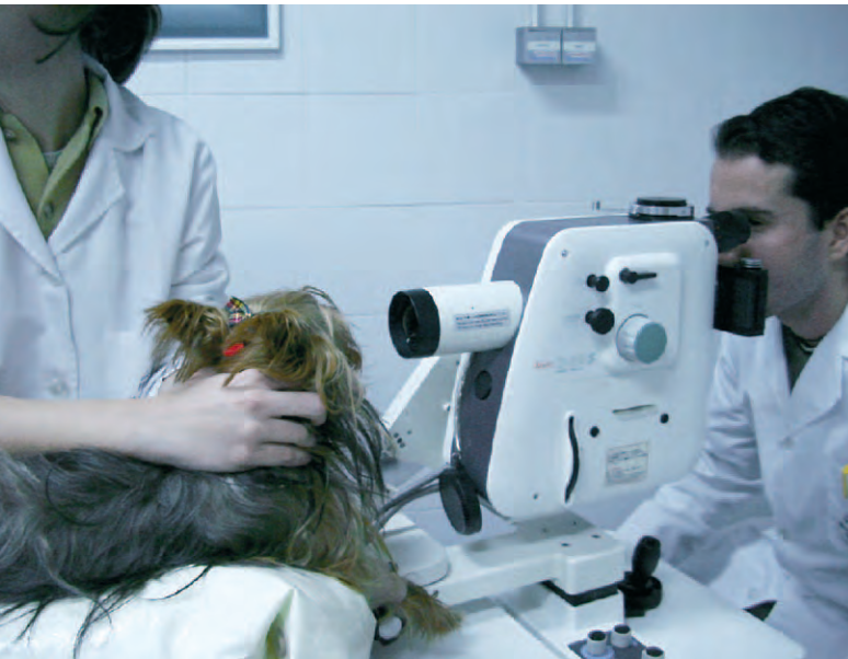
to 4. Realización de una angiografía fluoresceínica

nunca se consigue el plano anestésico requerido, debido a la rápida velocidad de metabolización del fármaco. Por ello se aconseja administrar la mitad de la dosis rápidamente y el resto lentamente a dosis efecto.