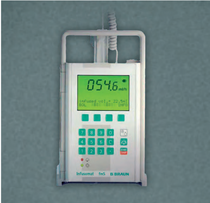
Foto 8. Bomba de infusión