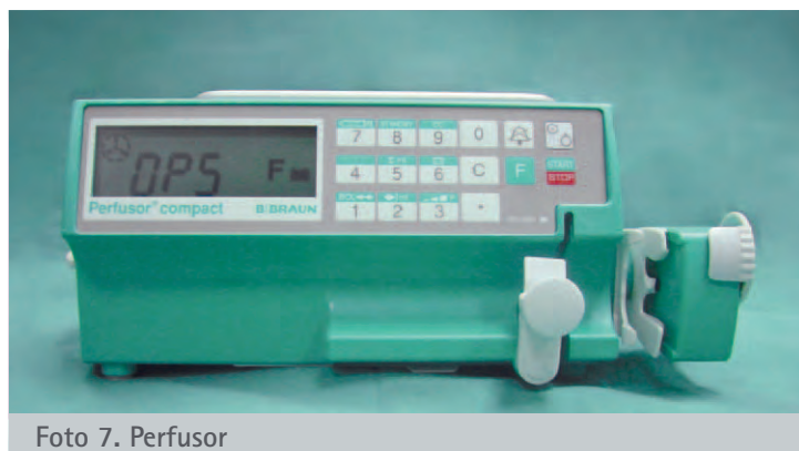
Foto 7. Perfusor