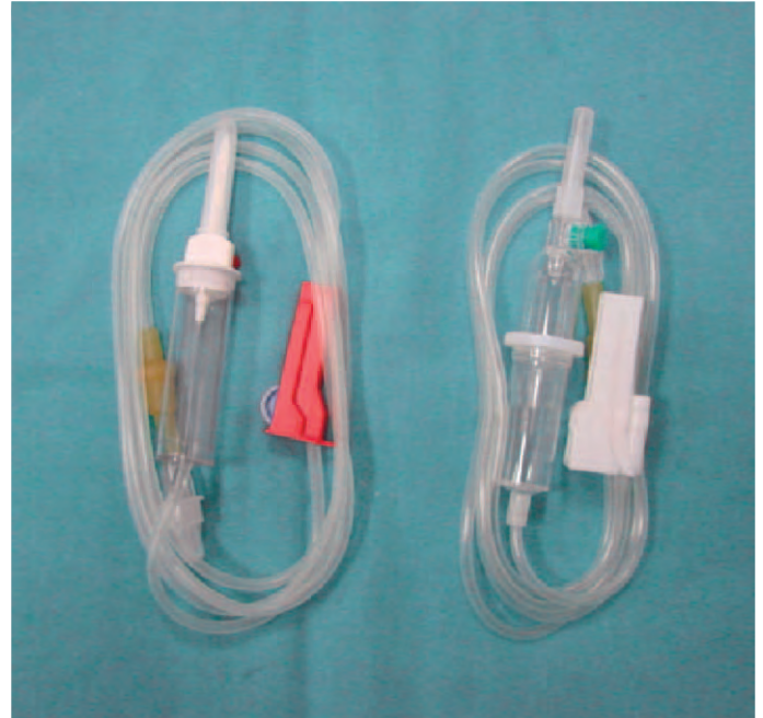
Foto 9. Equipos de infusión