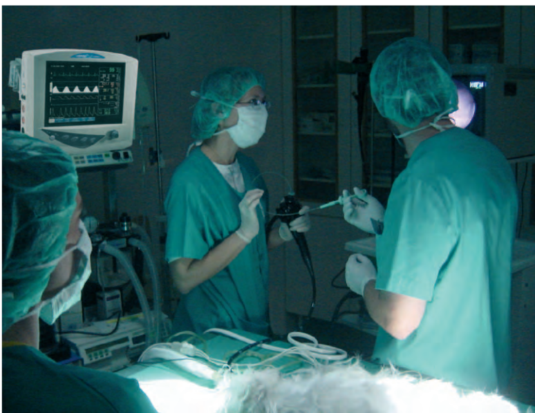
Foto 2. Endoscopia respiratoria. Tumor en cavidad nasal

Como ya hemos comentado, sólo se debe administrar por vía intravenosa. Se consigue una anestesia profunda, rápida y suave, aplicándolo solo o bajo diversos regímenes preanestésicos. La anestesia con propofol permite un magnífico control sobre el grado de profundidad del plano anestésico y una rápida modificación de éste. Se caracteriza por su recuperación muy rápida y sin efecto acumulativo.